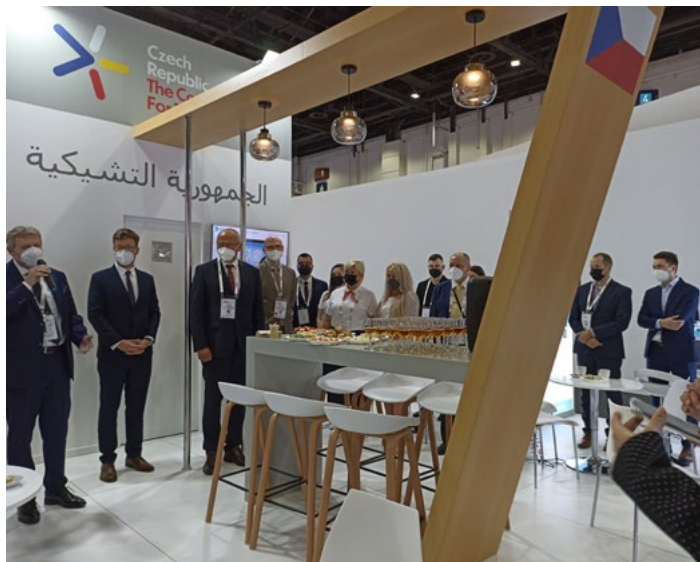
Již počtvrté prezentovaly členské firmy Asociace Grémium Alarm a Český klub bezpečnostních služeb svou činnost na mezinárodní výstavě v Dubaji.