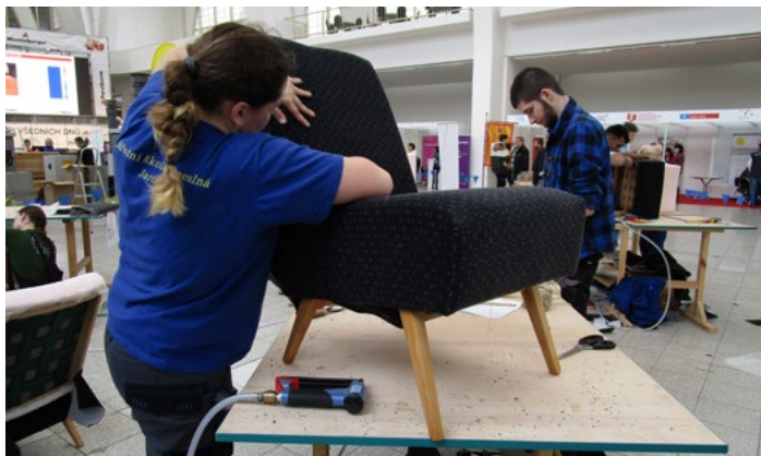
Žákovské mistrovství republiky čalouníků a truhlářů přivítá v dubnu brněnské výstaviště.