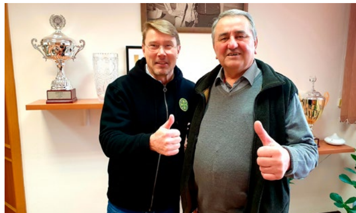
Bývalý mistr světa seriálu GP F1 si prohlédl prachatickou motokárovou výrobu.

chystá Komora exkurze na výrobní pracoviště firem MORAVIA CANS a ZÁLESÍ. Speciálně studentkám středních škol je věnován dubnový Girls Day – setkání studentek se zástupci vybrané technologické firmy, která dává příležitost ženám v technických profesích.