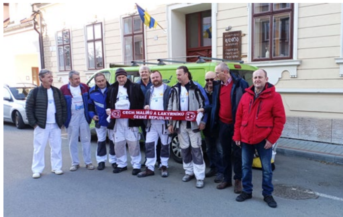
Malíři pomohli Diakonii v Soběslavi u Tábora.

K možnostem uplatnění v technických oborech připravila KHK Zlínského kraje několik akcí s touto tematikou. První proběhla na Vsetínsku, kde studenti Masarykova gymnázia ve Vsetíně a Gymnázia Františka Palackého ve Valašském Meziříčí navštívili firmy ONSEMI nebo CBG AUTOMATION. Na začátek dubna pro gymnazisty ze Slavičína a Valašských Klobouk